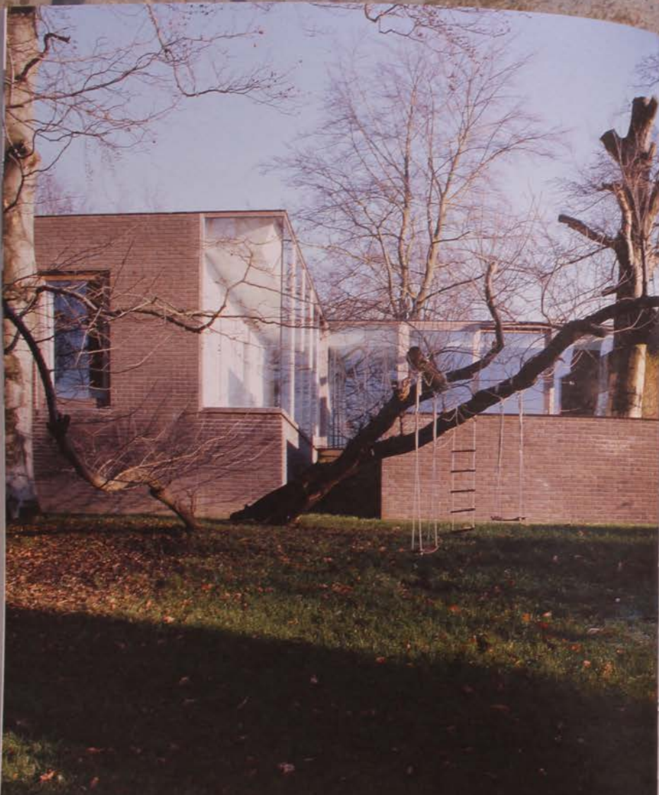
ARCHITECTEN BOE261 GOEDELE DESMET, IVO VANHAMME, JEAN-MICHEL