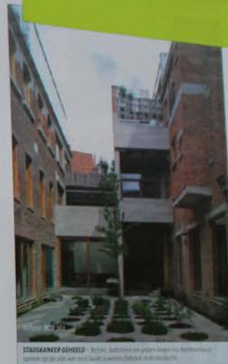
STADSKRANKER GEZHEID - Nieuw, duurzaam en groen leven in de binnenstad