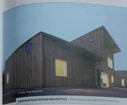
DIERENARTSCENTRUM MALPERTUIS - Voorziening voor functionaliteit en erfgoed

De jury gaf ook een pluimpje voor de eenvoudige maar vlekkeloos afgewerkte materialen: de betonnen balken, bakstenen en betonvloeren zijn zichtbaar gebleven of alleen maar geverfd. De ruwbouw was hier zijn eigen afwerking. De eenvoud benadrukt de functionaliteit van het gebouw, waar vier dierenartsen werken.