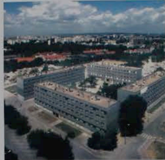
Vingt-deux secondes pour raser les dernières barres de La Courneuve (L'Empreinte 2004)