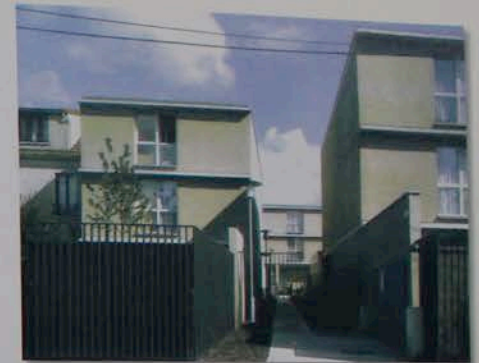
Densité 95 logements/hectare