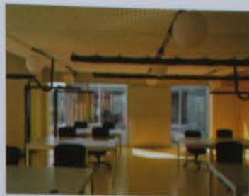
设计单位: BCKBO Architects 地点: 比利时的VDAB 落成日期: 2005年

这个曾列入World Architecture Festival (世界建筑节)入围名单的作品, 其设计充分考虑紧凑简洁、经济平衡的因素, 为办公室保证高而花园的办公室部分保持安静环境(特别加入院子部分性隔离), 与邻近居民保持相当距离, 以及防止对外部自然环境的破坏。因为停车位的位置是山地, 挖掘出的泥土部分被用于花园, 而园中植物使这些在建造过程中被轻度污染的土壤在自然得到净化的净化, 员工可以直接从停车场通过大楼的楼梯进入办公区域, 或者从公园里进去, 办公楼许多公共区域都面向街道, 员工在一片片花园树下工作惬意生活, 从行路到隔离空间(花园)再到大楼内部, 无论是开放空间和良好隔离, 还是保持私密性与透明度的平衡, 建筑师都充分从办公功能方面出发考虑。LE